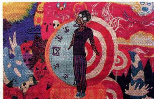
"Telekas" näeb nii Tartu oma Picassot, Miró kui Dalid.

Ekspositsiooni "Telekas" näeb Jõhvi kunstikooli galeriis 25. veebruarini.