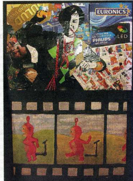
Telekapulti plöksides võib uppuda reklaamisaasta ja kohtuda paljude süüdimatute tegelastega.

Teisel seisab tool nimega "Lõngus". Disainitöö kahemõtteline pealkiri tuleb sellest, et istumise aluse moodustavad erivärvilised lõngakerad.